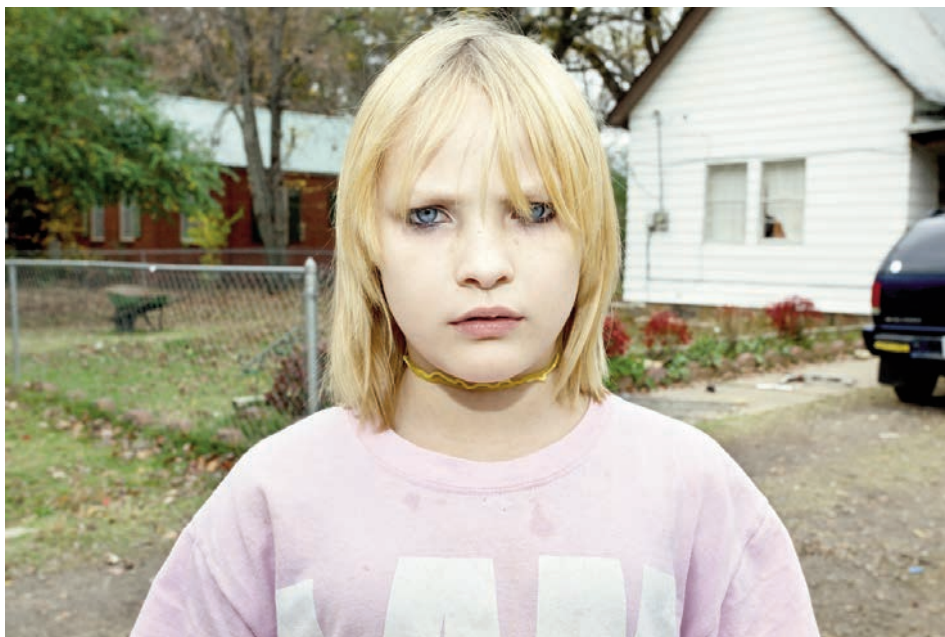
Sans titre / série I am, 2014

Un guide gratuit « collect foto » (co-édité avec AMA) renforce cette offre, il regorge d'informations, c'est l'outil idéal pour les jeunes collectionneurs ! D'ailleurs la plus jeune collectionneuse de cette édition 2014 s'appelle Marion et... elle n'a que 8 ans !