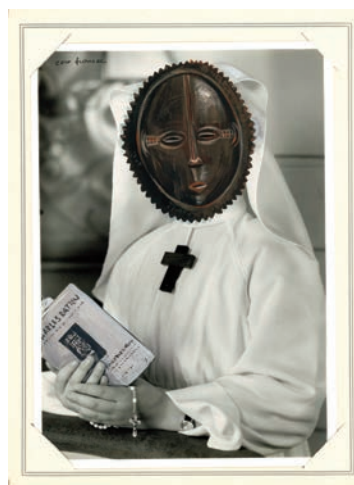
La Communiant / Chimères et Merveilles, 2010 © Coco Fonsac