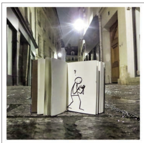
Lost in the city / Elyx by YAK, 2014 © Yacine Ait Kaci, courtesy Bettina von Arnim

Quant au jazz live, il fait partie de l'ADN de fotofever : il rythme les fins de journée de la foire. La fever doit se propager !