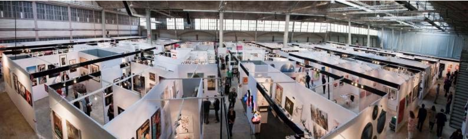
La foire AAF à la Halle Freyssinet à Paris du 27 au 30 mai 2010