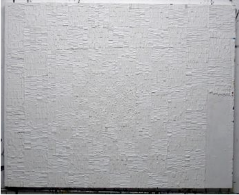
Machine 1, 2006, Acrylique sur bois, 122 x 152 cm