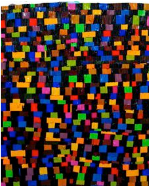
The Rainbow's end # 5, 2006, acrylique sur bois, 50 x 40 cm