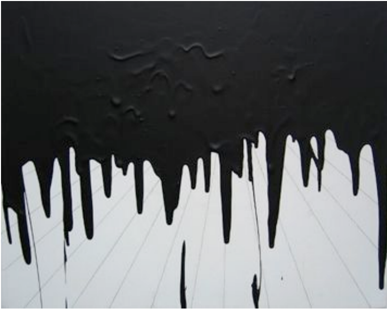
The end, 2006, acrylique sur bois, 40 x 50 cm